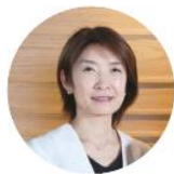
楽天少額短期保険株式会社 代表取締役社長