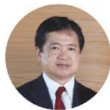
楽天生命保険株式会社 代表取締役社長