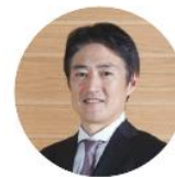
楽天損害保険株式会社 代表取締役社長