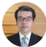
楽天インシュアランス ホールディングス株式会社 代表取締役社長