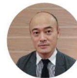
楽天インシュアランス プランニング株式会社 代表取締役社長